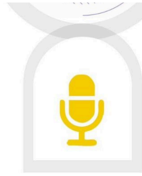
مع المدربة أ. فاطمة عوني